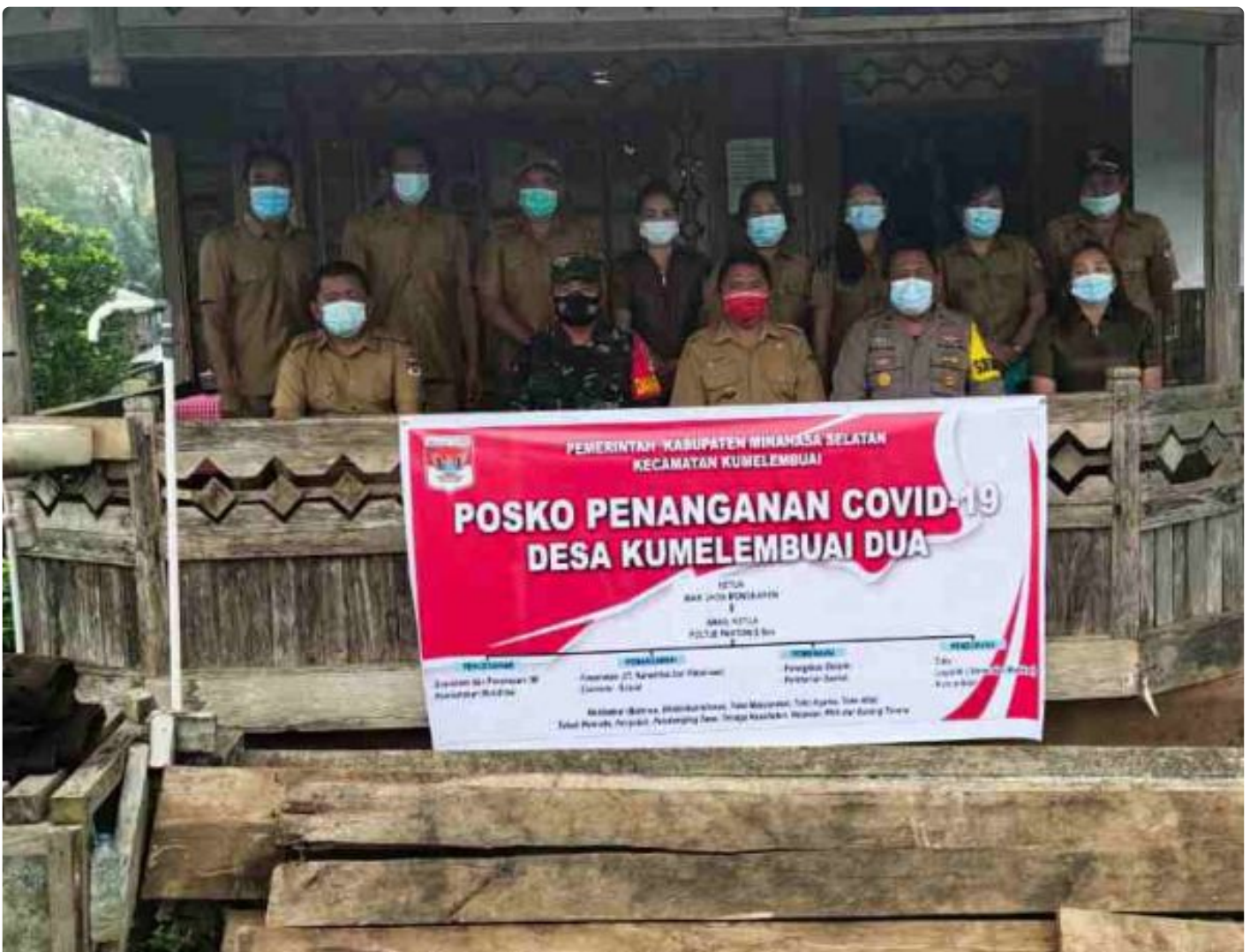
Posko Penanganan Covid-19

MANADO- Sejumlah Posko PPKM atau Pemberlakuan Pembatasan Kegiatan Masyarakat di wilayah Kabupaten Minahasa Selatan, diresmikan